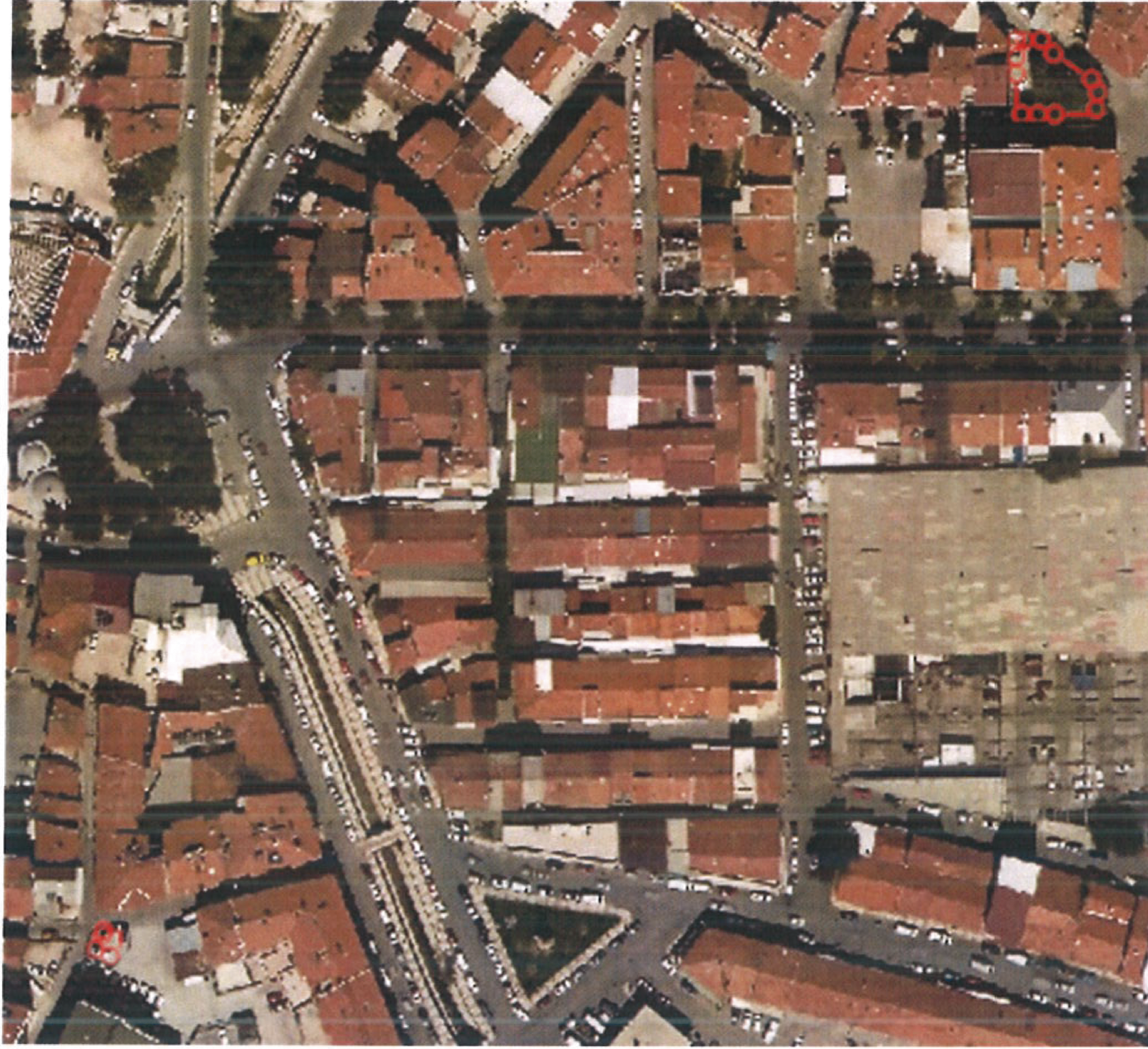
HARİTA 5: PLANLAMA ALANI YAKIN ÇEVRE ULAŞIM BAĞLANTILARI

Plan değişikliği yapılması düşünülen alan İslice ve Küme Mahalleleri sınırları içerisinde kent merkezine 550 metre mesafede, Uşak Havaalanına yaklaşık 5,2 kilometre mesafede, İzmir-Ankara Karayoluna yaklaşık 830 metre mesafededir.