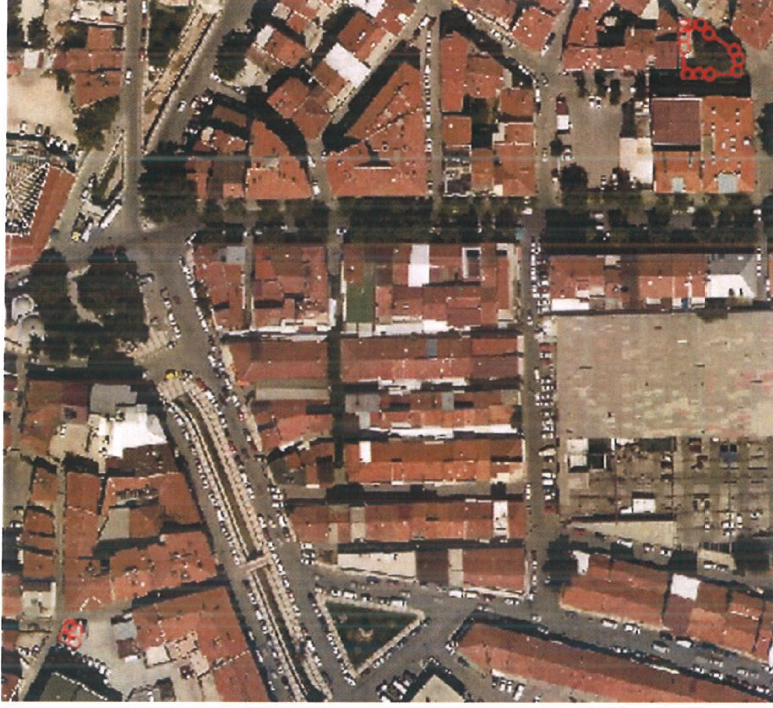
HARİTA 3: UYDU GÖRÜNTÜSÜ

Devlet Planlama Teşkilatı tarafından 2004 yılında yapılmış olan "İlçelerin Sosyo-Ekonomik Gelişmişlik Sıralaması Araştırması" na göre, Uşak Merkez ilçesi 872 ilçe içerisinde 52. sırada olup 2. derece gelişmiş ilçeler arasında yer almaktadır.