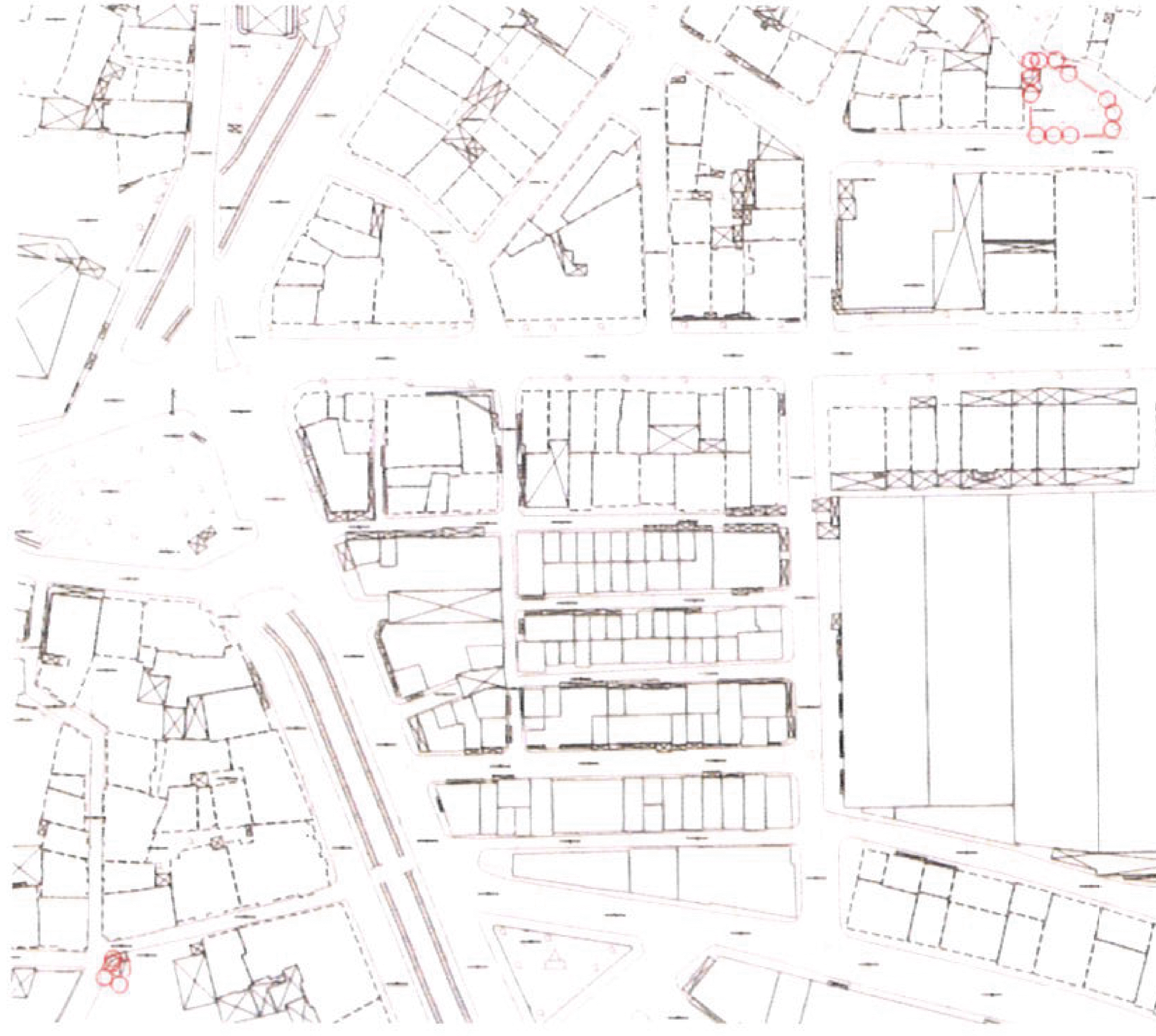
HARİTA 7: PLANLAMA ALANI 1/1000 ÖLÇEKLİ HALİHAZIR HARİTA