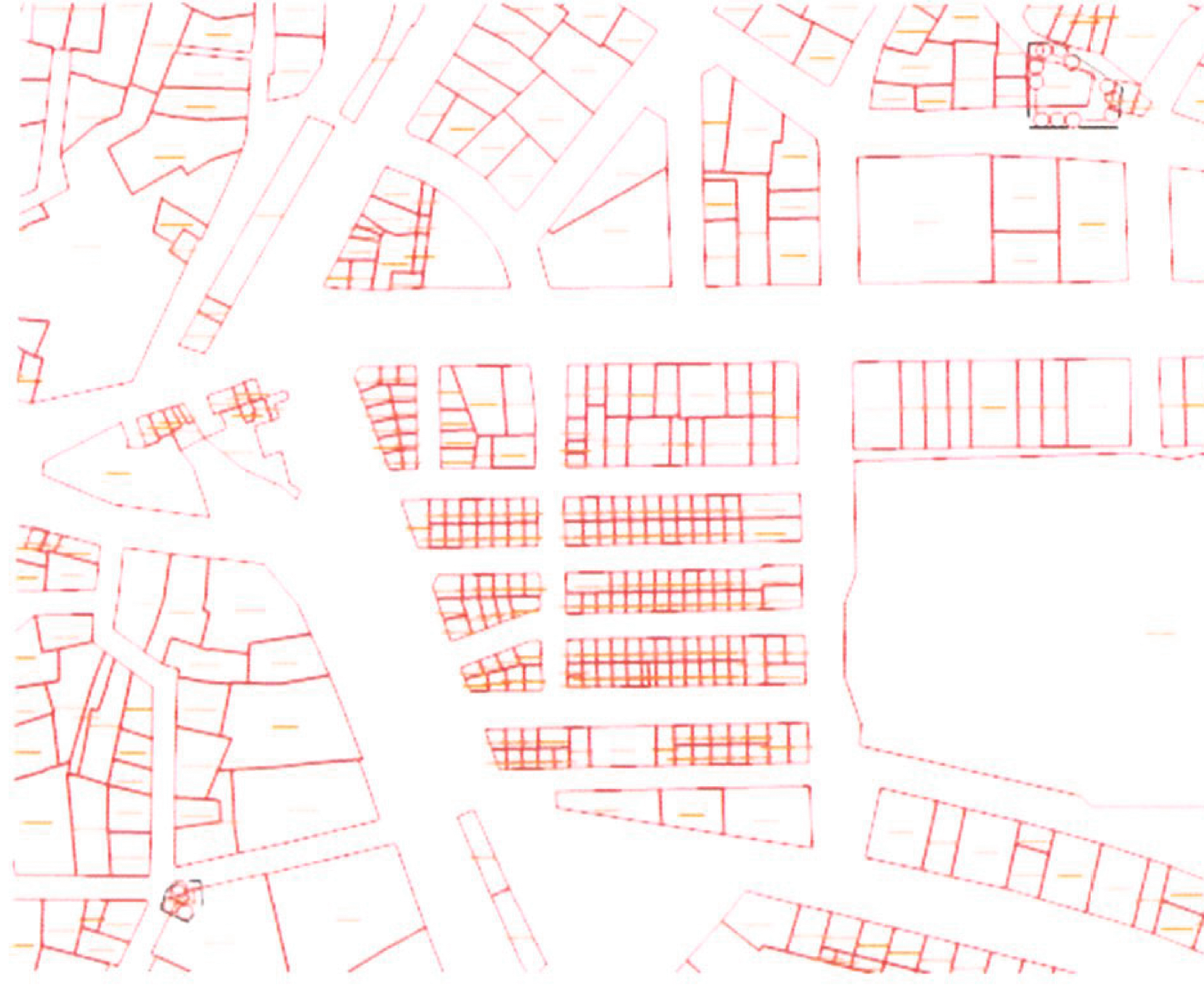
HARİTA 6: PLANLAMA ALANI KADASTRO HARİTASI